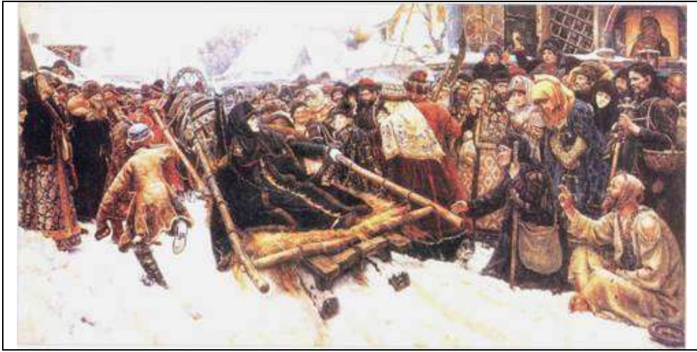
Боярыня Морозова. Художник В. Серов