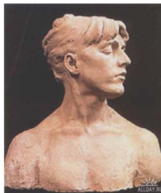
Девушка с закрытыми глазами