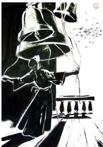
(Рис. Ю. Чистякова)