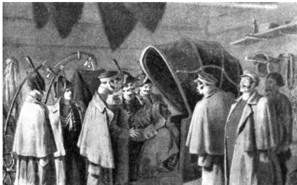
Картинка с выставки. Гусарская баллада