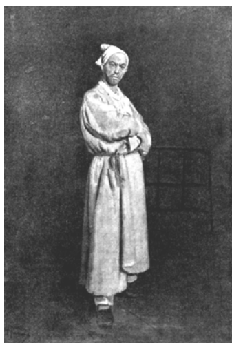
Картинка с выставки. Опальный чиновник; воспоминания о будущем — как бы не забыть номер своего швейцарского счета?

Народ наш добрый по русской привычке жалел Тетерю, поговаривал: «Опасная это профессия — быть губернатором!»