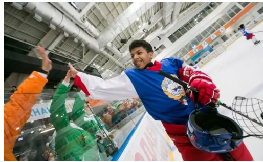
Вратарю хоккейной сборной Кувейта на международных играх «Дети Азии» пришлось, пожалуй, труднее всех...