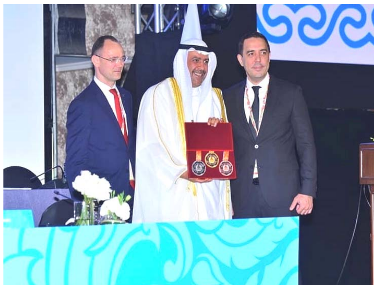
Кувейтский шейх Ахмад Аль-Фахад Аль-Сабах вновь возглавил Олимпийский Совет Азии