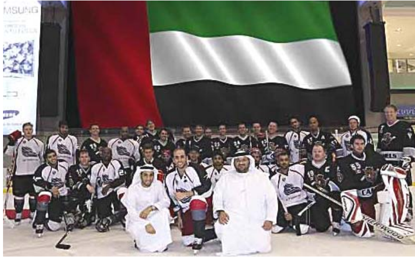
Хоккейная лига Объединенных Арабских Эмиратов: «Уж лучше вы к нам...»