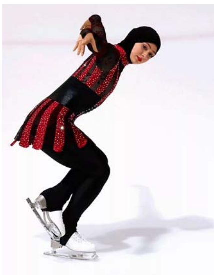
Захра Лари из Абу-Даби — «Принцесса льда в хиджабе»