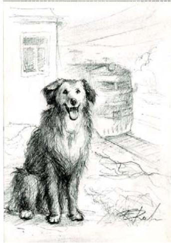
Иллюстрация к рассказу художницы Е. Рамсдорф (Германия)

— Вставай, а то коньки отбросишь. Совсем замерзнешь,— продолжала уговаривать клыкастая пасть, и вдруг начала гавкать.